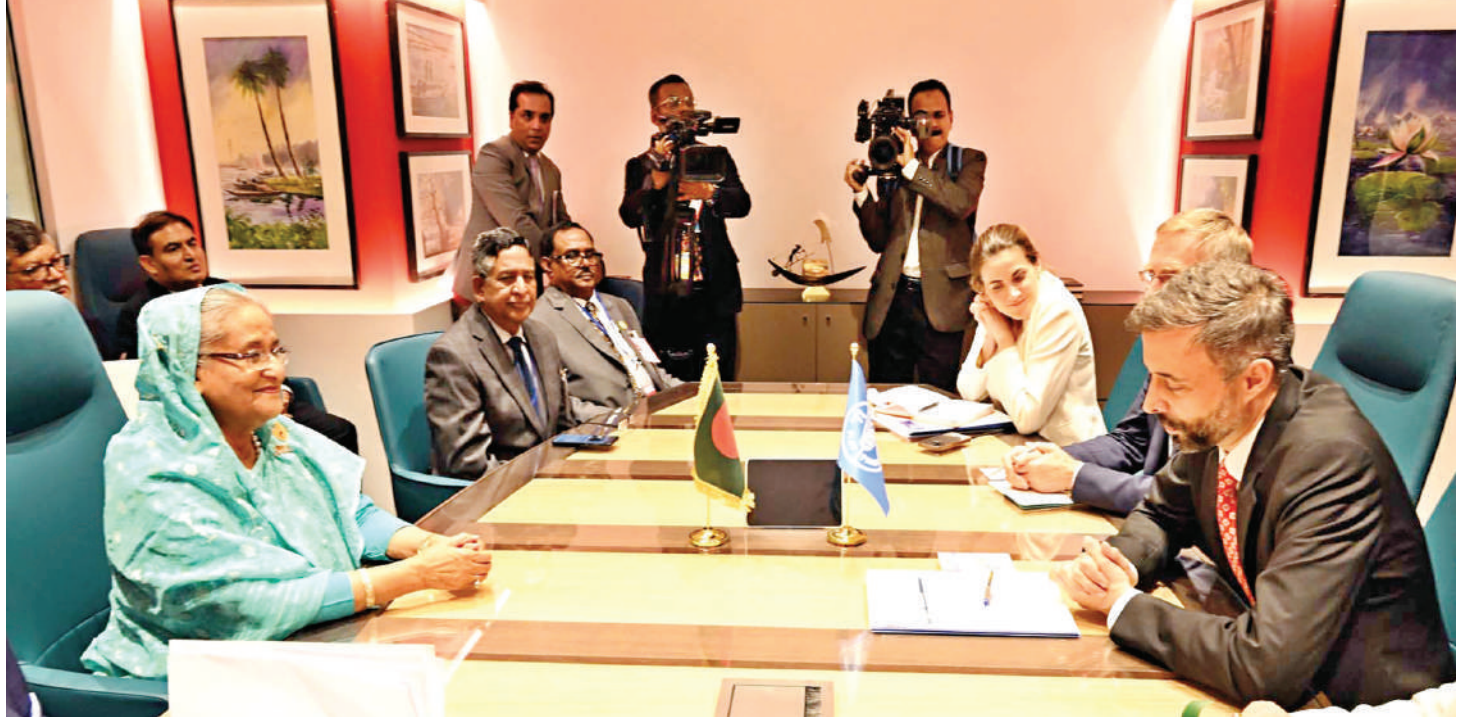
মাননীয় প্রধানমন্ত্রী শেখ হাসিনার সাথে ইতালির রোমে জাতিসংঘের খাদ্য ও কৃষি সংস্থার (এফএও) সদর দপ্তরে বাংলাদেশ-বঙ্গবন্ধু শেখ মুজিব কক্ষে ইন্টারন্যাশনাল ফাউন্ডেশন অব এগ্রিকালচারাল ডেভেলপমেন্টের (আইএফএডি) প্রেসিডেন্ট Alvaro Lario সাক্ষাৎ করেন (সোমবার, ২৪ জুলাই ২০২৩)।