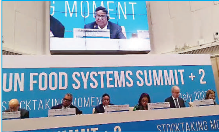
জাতিসংঘের খাদ্য ও কৃষি সংস্থার সদর দপ্তরে ইউএন ফুড সিস্টেমস সামিটের কৃষি খাদ্য ব্যবস্থার রূপান্তর শীর্ষক প্লেনারি সেশনে প্যানেলিস্ট হিসেবে বক্তব্য রাখছেন মাননীয় কৃষিমন্ত্রী, ড. মোঃ আব্দুর রাজ্জাক এমপি

নানামুখী চ্যালেঞ্জ মোকাবিলা করে ভবিষ্যতে খাদ্য নিরাপত্তা বজায় রাখতে বাংলাদেশ সরকার সর্বোচ্চ গুরুত্ব দিয়ে সব রকমের প্রস্তুতি নিয়ে এগোচ্ছে বলে মন্তব্য করেছেন