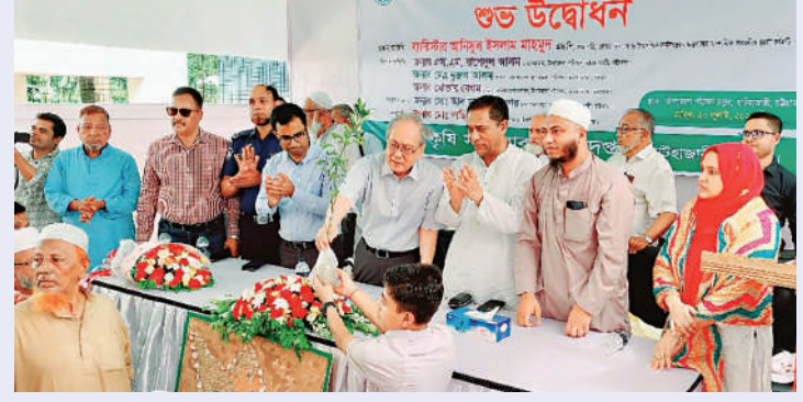
ফলের চারা বিতরণ করছেন ব্যারিস্টার আনিসুল ইসলাম মাহমুদ এমপি, হাটহাজারী, চট্টগ্রাম

মাননীয় প্রধানমন্ত্রী শেখ হাসিনার নেতৃত্বে স্মার্ট কৃষিনির্ভর দেশ গড়ার মাধ্যমে দেশকে খাদ্যে স্বয়ংসম্পূর্ণ করতে সকলকে ঐক্যবদ্ধভাবে কাজ করতে হবে। ২০ জুলাই ২০২৩ বৃহস্পতিবার নোয়াখালী, ফেনী, লক্ষ্মীপুর, চট্টগ্রাম ও চাঁদপুর কৃষি উন্নয়ন প্রকল্পের আওতায় হাটহাজারীতে তিন দিনব্যাপী কৃষি মেলার উদ্বোধনী অনুষ্ঠানে প্রধান অতিথির বক্তব্যে ব্যারিস্টার আনিসুল ইসলাম মাহমুদ, এমপি. এসব কথা বলেন। তিনি বলেন গত শীত মৌসুমে হাটহাজারী উপজেলা, চট্টগ্রামের সমস্ত উপজেলার মধ্যে সর্বোচ্চ সরিষা উৎপাদন করে রেকর্ড সৃষ্টির মাধ্যমে আলোড়ন সৃষ্টি করেছেন। উপজেলা পরিষদ চত্বরে